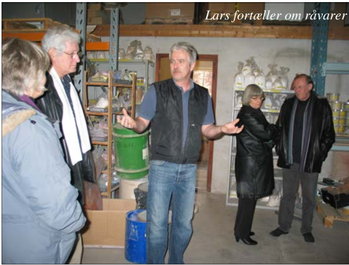
Lars fortæller om råvarer